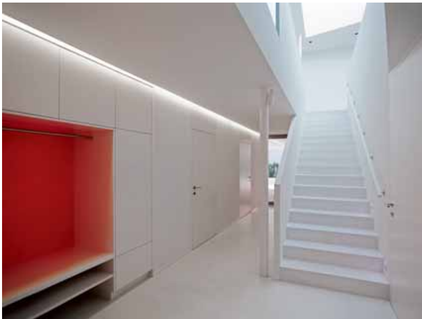
Weiß ist eindeutig die dominante Farbe und zudem erfüllt viel Tageslicht die Räume.