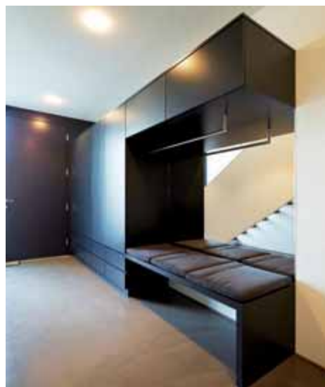
Blickfang gleich beim Eingang: die maßgeschneiderte Garderobe in Anthrazit.