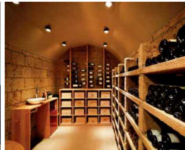
Das Haus im Hang weist einen Höhenunterschied von fast 12 Metern vom Weinkeller bis zum Pool auf.